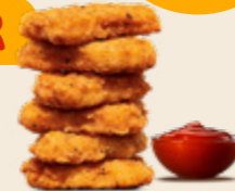
6er Chicken Nuggets