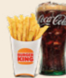
Regular Pommes & 0,5 L Softdrink