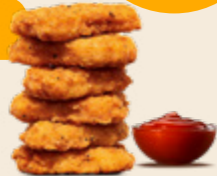
6er Chicken Nuggets