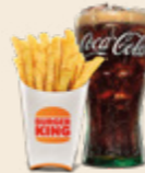
Regular Pommes & 0,5 L Softdrink