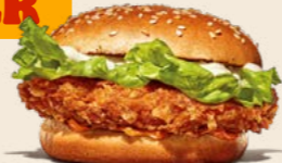
Curry Crispy Chicken