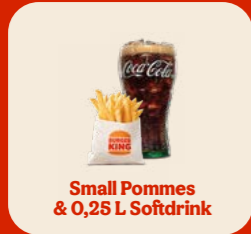
Small Pommes & 0,25 L Softdrink